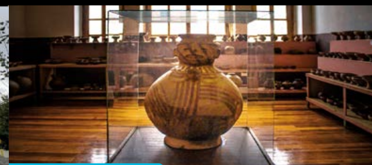
Museo Escuela Isidro Ayora

Una casa antigua que forma parte del conjunto arquitectónico del Centro Histórico de la ciudad y sus paredes imponentes de piedra vista, es el refugio de una extensa muestra de distintas especies de animales diecadas que fueron recolectadas y donadas a través de los años por varias instituciones e Ilustres latacungueños; también forma parte de esta colección, las piezas de los laboratorios de química y física del Colegio Vicente León, mismas que fueron importadas desde Europa en el año 1855.