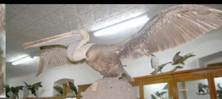
Museo Rafael Betancourth