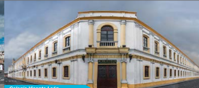
Colegio Vicente León

EL CAPITÁN: Representa al corregidor español -máxima autoridad- del Asiento de San Vicente Mártir de Tacvnga; en jocosos marcha al ritmo de la banda de pueblo, comanda su delegación; su traje de estirpe militar lleno de condecoraciones hacen gala de su impomencia y autoridad.