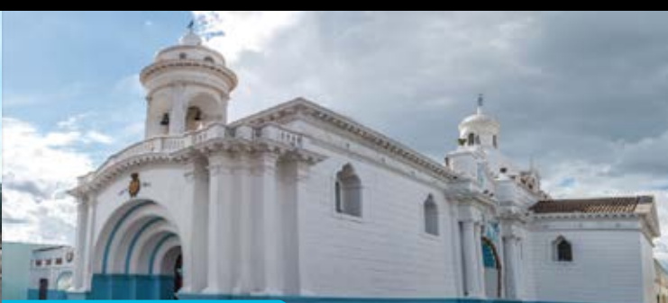
Iglesia de la Merced

Construida en el siglo XVII junto al convento, con la advocación a San Jacinto, testigo de la Gesta Independentista de valerosos Latacungueños que se alzaron en armas en contra del yugo español, por sus corredores aún se escuchan los cánticos que los Frailes Dominicos dedican a Nuestra Señora del Rosario, patrona de los terremotos. La riqueza artística religiosa que alberga en sus muros deslumbrará a propios y extraños, se exhiben muestras pictóricas de los afamados: Fray Pedro Bedón y Fray Enrique Mideros, así como también esculturas en madera que se presume provienen de la "Escuela Quitueña".