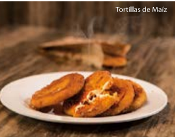
Tortillas de Maíz