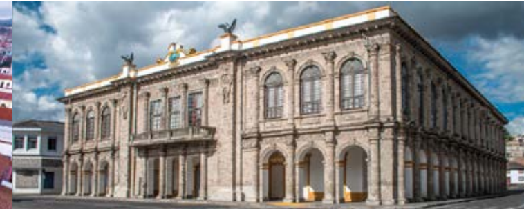
Palacio Municipal de Latacunga

Su construcción inició en 1910 con diseño del Arquitecto José María Pereira, está ubicado al costado oriental del Parque Central, su fachada -trabajada de forma íntegra en piedra pómez- la convierte en ícono arquitectónico único del país y del mundo. Es desde este lugar que se dirige el destino de la ciudad y cantón, pues alberga a la máxima autoridad de éste hermoso rincón del Ecuador, en su interior se pueden observar murales, que representan el civismo y patriotismo de la estirpe Latacungueña, así como también, un salón de honor de hermosos atributos y ornamentos.