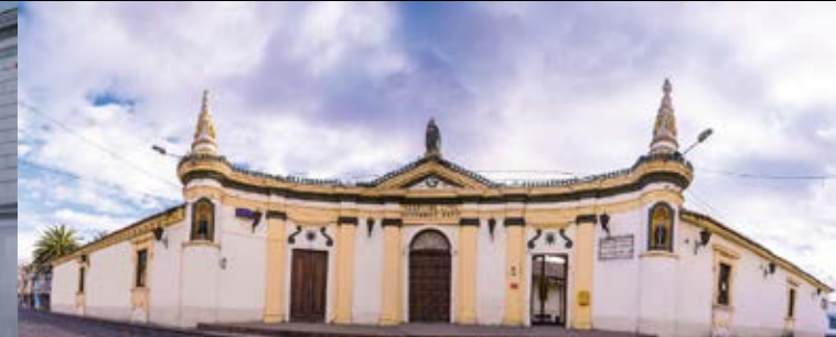
Hospital Hermanas Páez