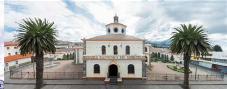
Universidad de las Fuerzas Armadas

Construcción en calicanto, levantada por la Orden Jesuita en 1.676, consta de un conjunto enorme de rocas, cuyo funcionamiento -a base de un sistema hidráulico- sirvió para la molienda de granos secos producto de la actividad agrícola de la zona. El nombre de los molinos proviene de la devoción a la Virgen Negra de Monserrat. En la actualidad, es el espacio cultural más activo de la ciudad, pues, en su interior, alberga una vasta muestra museográfica y un teatro en constante funcionamiento gracias a la actividad propia de la Casa de la Cultura Benjamín Carrión "Núcleo de Cotopaxi".