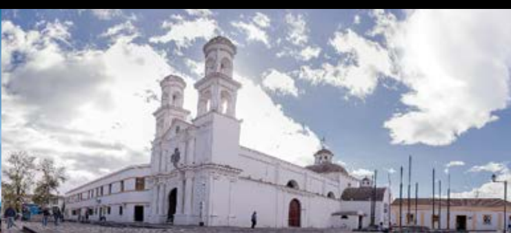
Iglesia de Santo Domingo

Bebida que se remonta a la época prehispánica del Ecuador, con una gran cantidad de ingredientes que fueron añadidos con el pasar de los años y forma parte de nuestra cocina barroca; se elabora a base de harina de maíz negro, frutas y varias especies saborizantes y aromáticas que le dan su peculiar sabor.