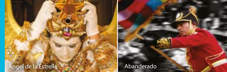
Angel de la Estrella