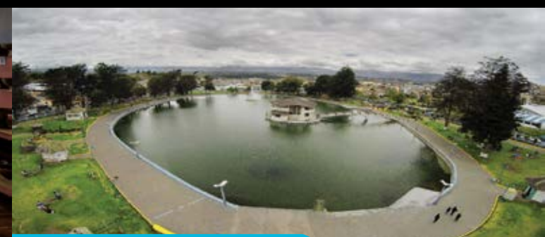
Parque Náutico Ignacio Flores "La Laguna"

Construida en la primera mitad del siglo XVIII, propiedad del Marqués de Miraflores, el Coronel de Milicias Antonio Flores de Vergara, padre de quien fuera el Presidente de la Real Audiencia de Charcas -hoy Bolivia- el Ilustre Latacungueño Ignacio Flores de Vergara. Construida a base de piedra pómez, éste icónico emplazamiento de la ciudad, refleja el estilo de vida de la nobleza que la edificó y habitó, en varias de las bóvedas que conforman este conjunto arquitectónico se puede observar arabescos mudéjares tallados en piedra pómez material propio y predominante de la zona.