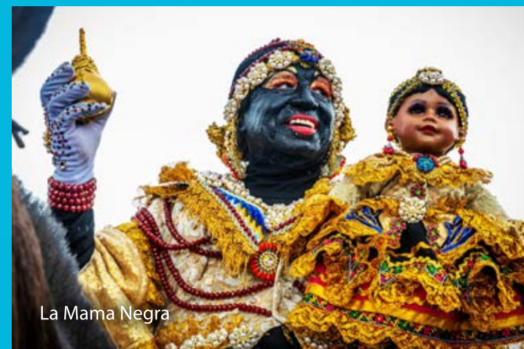
La Mama Negra