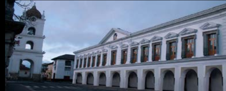
Edificio de la Gobernación

Su construcción inició en 1910 con diseño del Arquitecto José María Pereira, está ubicado al costado oriental del Parque Central, su fachada -trabajada de forma íntegra en piedra pómez- la convierte en ícono arquitectónico único del país y del mundo. Es desde este lugar que se dirige el destino de la ciudad y cantón, pues alberga a la máxima autoridad de éste hermoso rincón del Ecuador, en su interior se pueden observar murales, que representan el civismo y patriotismo de la estirpe Latacungueña, así como también, un salón de honor de hermosos atributos y ornamentos.