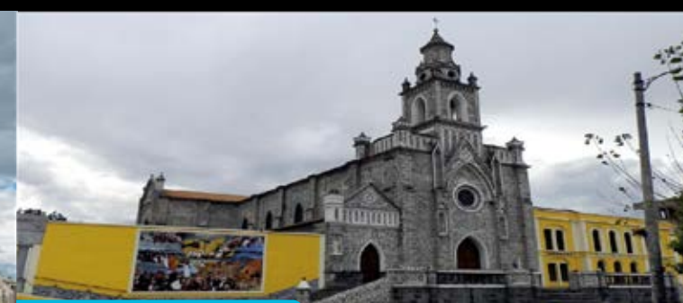
Iglesia de San Felipe

Con la llegada de los Agustinos en 1579 se fundó la Iglesia y Convento con la dedicación a "San Bernabú", esta edificación ha sido devastada por la inclemencia de varios eventos telúricos que azotaron la zona; en el mismo sitio, hoy se levanta una magnífica edificación que consta de una sola nave con crucero y dos capillas anexas, un cimborrio o cúpula de artística estructura copia de la cúpula de San Pedro de Roma, junto a ésta se levanta el espacio conventual. En su interior se puede observar una rica colección de obras de arte relacionadas a la vida religiosa de la Orden Agustina.