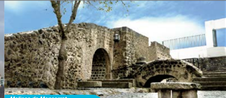
Molinos de Monserrat