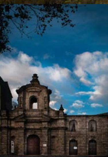
Iglesia de San Francisco

Construida a finales del siglo XVI, constituye la edificación religiosa más antigua de la ciudad, su cúpula románica es testimonio fiel de lo que fue la iglesia fundacional de la urbe, es testigo del paso del tiempo y sobreviviente de varios eventos telúricos que provocaron afecciones estructurales que generaron la refacción y reconstrucción de ciertos espacios que cedieron a tales sucesos. En su interior, se puede observar varias obras de arte propias de la Orden Franciscana conocida también como la "Orden de los Frailes Menores"; en ella se dio culto a la Inmaculada Concepción de Jesús. La edificación actual fue construida después del terremoto del 5 de agosto de 1949.