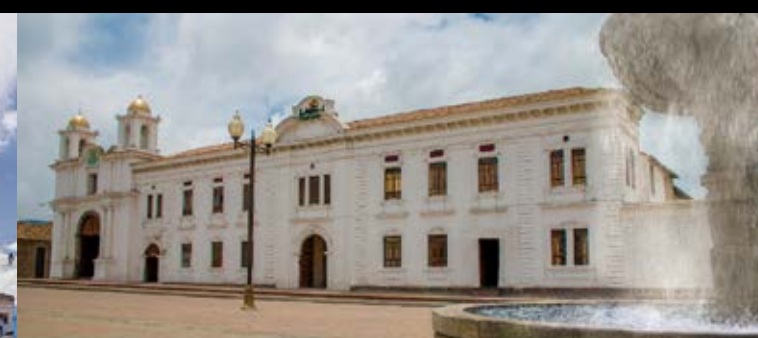
Iglesia de San Agustín

Se ubica al costado occidental del Parque Vicente León, consiste en una edificación de estilo republicano construida a base de piedra pómez desde 1899, se encuentra sobre el espacio donde funcionó el "figón" de propiedad de la heroína Latacungueña Baltazara Terán, quien jugó un papel importante y decisivo en la campaña independentista de la ciudad de 1820. Constituye el símbolo del Poder Estatal Central pues en su interior, alberga las funciones administrativas del representante del Gobierno Central en la Provincia de Cotopaxi.